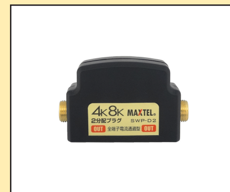
ノイズカット高シールド構造 SWP-D 2-P